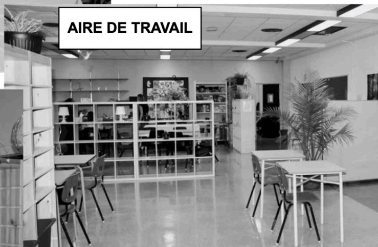
AIRE DE TRAVAIL