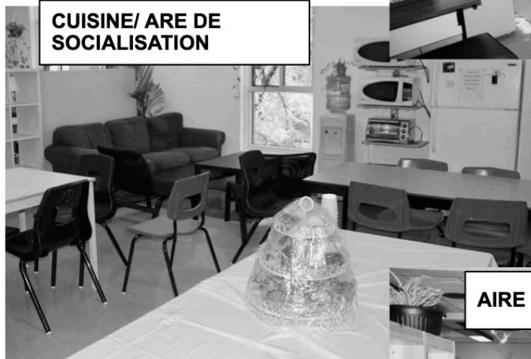
CUISINE/ ARE DE SOCIALISATION