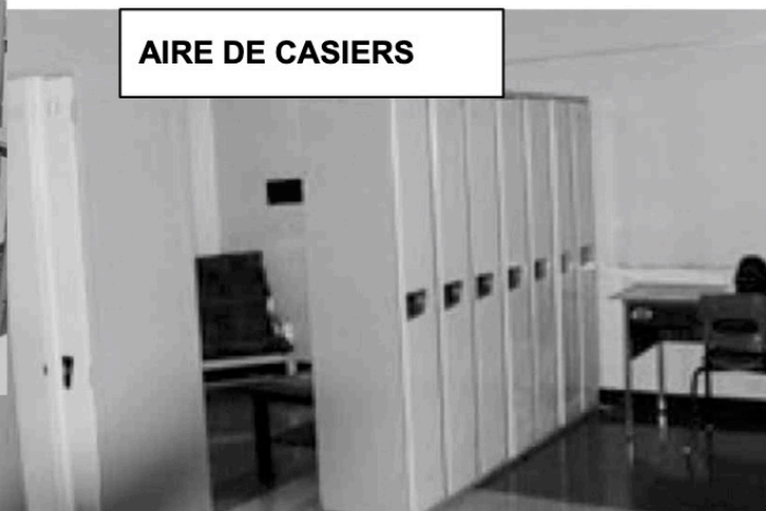
AIRE DE CASIERS