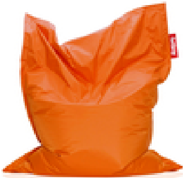
Coussin Bean Bag « Fatboy »