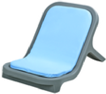
Transat monobloc confort