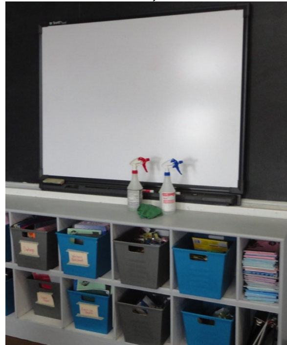
Tableau effaçable à sec