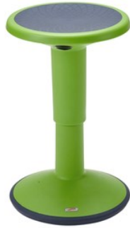
Tabouret oscillant de hauteur ajustable