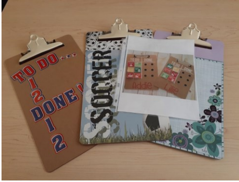
Planchettes à pince