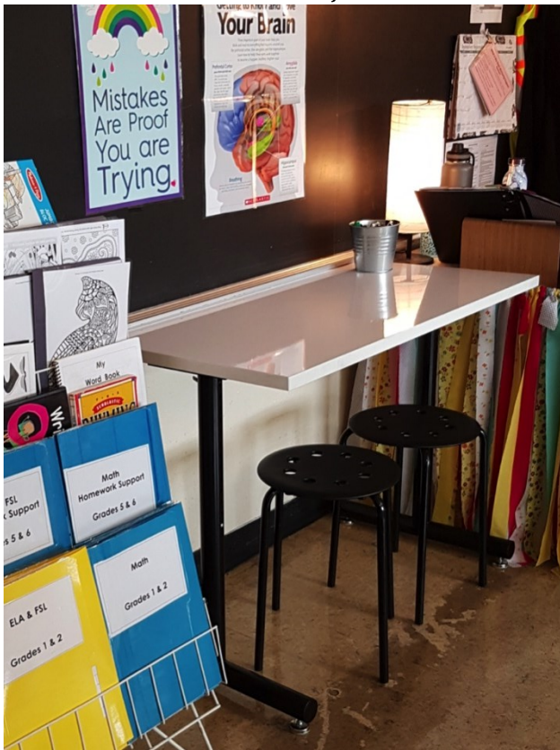
Table à dessus effaçable à sec