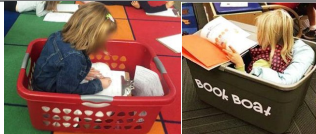
Panier de travail/Bateau de lecture