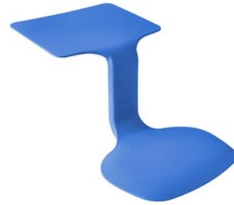
Le Surf- Poste de travail portatif