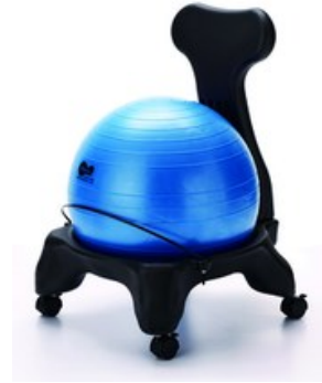
Chaise ballon moderne