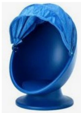
Fauteuil Oeuf Pivotant - IKEA/PS LÖMSK