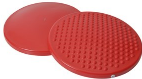
Coussin Disc 'o' Sit