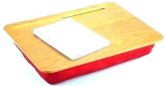
Plateau sur coussin de billes