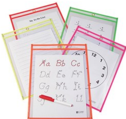
Pochettes réutilisables à essuyage à sec