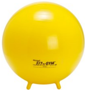
Ballon d'exercice avec pattes