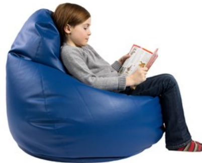
Pouf poire Bean Bag